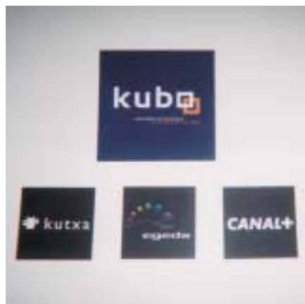
Vista frontal del panel de patrocinadores de la Exposición 1000 Imágenes.

Los asistentes al Festival han sido informados sobre EGEDA y sus actividades a tra-