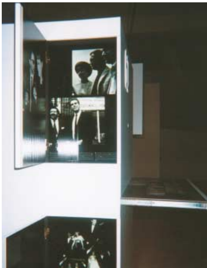
Diferentes aspectos de la exposición.