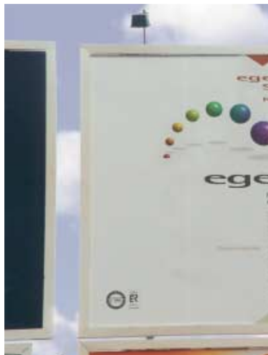
Valla publicitaria de EGEDA frente al Hotel María Cristina de San Sebastián.