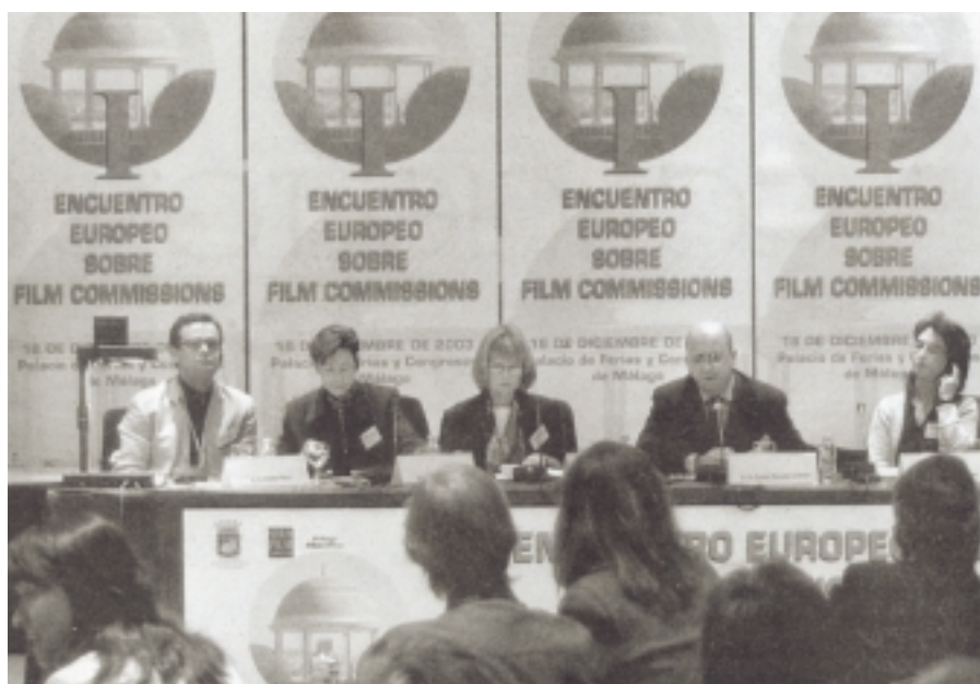
Los representantes de Irlanda, Alemania, la AFCI, España, y Francia..

Las Film Commissions son ya un instrumento de gran utilidad para los países de Europa en que operan para promocionar su imagen y promover su industria audiovisual mediante la captación de rodajes de obras audiovisuales de todo tipo.