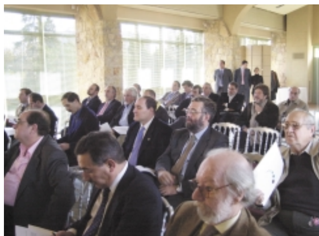
Aspecto de la sala donde se celebró la Junta General.

Se informa de que se ha creado una sociedad denominada ISANIA a nivel internacional, constituida entre AGICOA y CISCAC. En el ámbito interno se pueden crear agencias regiona-