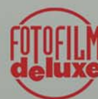
Image Laboratories, S.L. - c/Rafael Barradas (antes Carme) 1-3, Pol. Ind. Gran Via Sur 08908 L'Hospitalet (Barcelona) - Tel. +34 93 261 85 05 - www.imagefilm.com

Fotofilm Deluxe, S.L. - c/Pilar de Zaragoza, 30 - 28080 Madrid Tel. +34 91 725 36 07 - www.fotofilm deluxe.com