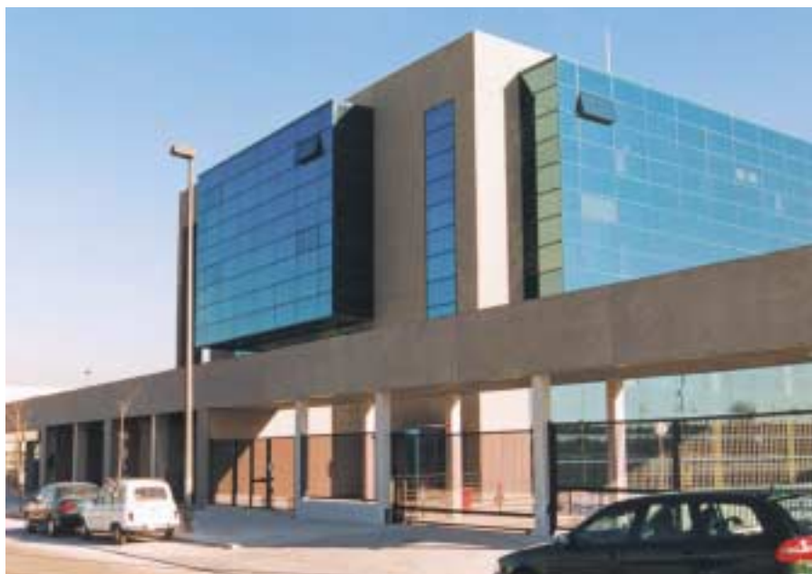
Edificio Egeda, en la Ciudad de la Imagen.

Este fondo se utiliza para las actividades de defensa de los derechos de nuestros socios (asistencial) y para promocionar el conocimiento de cuanto se refiere a la propiedad intelectual en el sector audiovisual y directamente la actividad de éste (promocional). Así, se presta apoyo a FA-PAE, la Academia de Cine, la Filmoteca, se participa con el ICAA en el fondo para el desarrollo de guiones, se mantienen convenios con entidades como la ECAM, de la