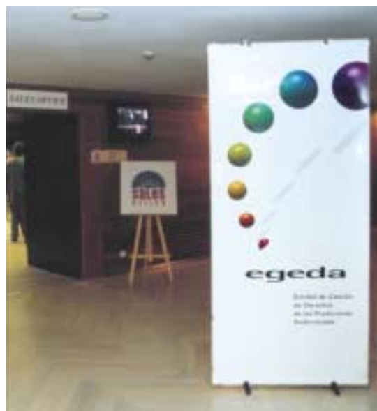
Hall de entrada a la Sales Office.

Este patrocinio se encuadra dentro del marco de colaboración entre EGEDA y el Festival, que incluye la exposición 1000 Imágenes, inaugurada en la edición 48, y que actualmente se encuentra en su fase itinerante. Se ha exhibido ya en Madrid, y próximamente lo hará en Sevilla y en Barcelona.