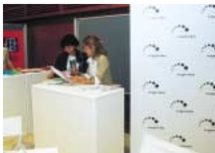
Stand de EGEDA en la Sales Office.