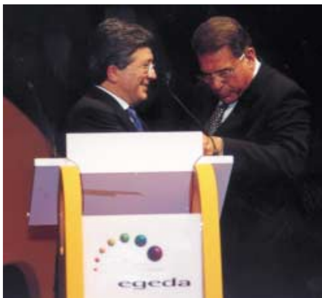
Enrique Cerezo y Juan Luis Galiardo