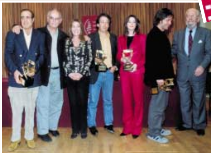
Carlos Saura y Carmen Maura con los premiados

La Asamblea de Directores Realizadores Cinematográficos Españoles (ADIRCAE) celebró el 22 de mayo el acto de entrega de la XVII edición de sus premios anuales, que contó con el patrocinio de EGEDA, y al que acudió una nutrida representación del mundo del cine.