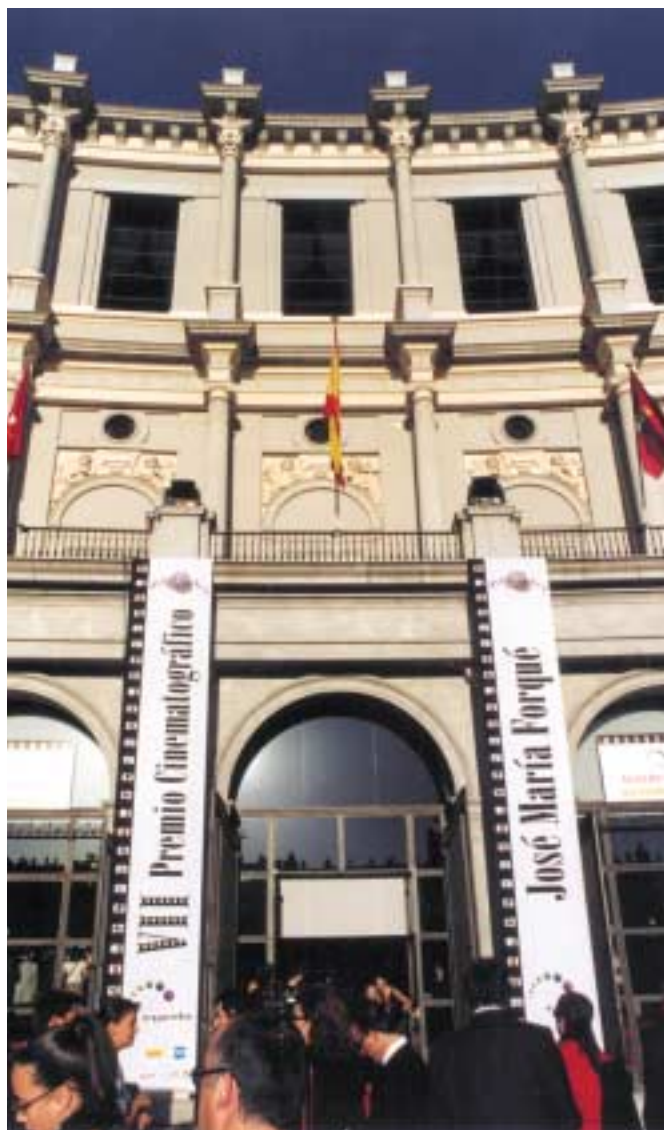
Entrada principal al Teatro Real durante la Gala (reportaje en páginas interiores)

El lunes 29 de abril de 2002 se celebró la gala de entrega del VII Premio Cinematográfico José M a Forqué, que, por primera vez, tuvo lugar en el Teatro Real, y contó con la presencia de cerca de mil ochocientas personas, entre las que había una nutrida representación del mundo de la cultura, especialmente del cinematográfico, así como numerosos representantes de los medios de comunicación: prensa, radio y televisión.