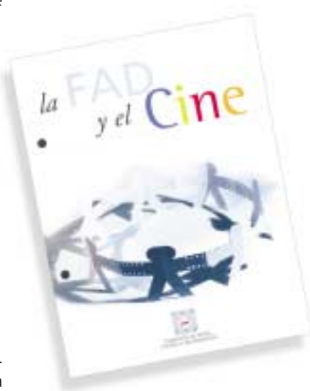
La Fundación de Ayuda contra la Drogadicción con el cine español

[El Grupo LIM, orquesta de Cámara que cuenta, entre otros, con el Premio Nacional del Disco, 1986, del INAEM, interpretó para los presentes, durante un cuarto de hora, una selección de música cinematográfica: El Golpe, Casablanca, Suspiros de España].