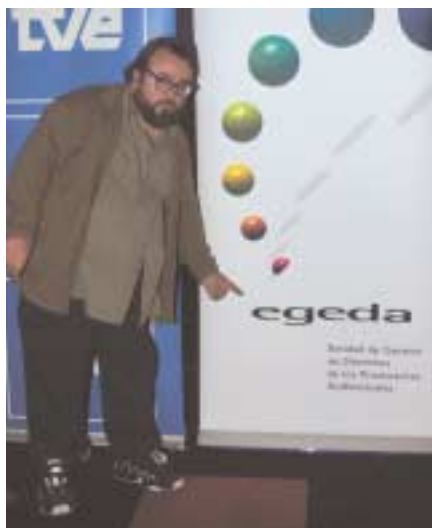
Alex de la Iglesia.