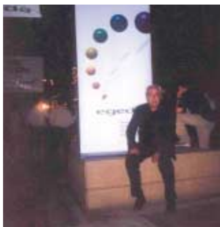
Antonio Giménez Rico