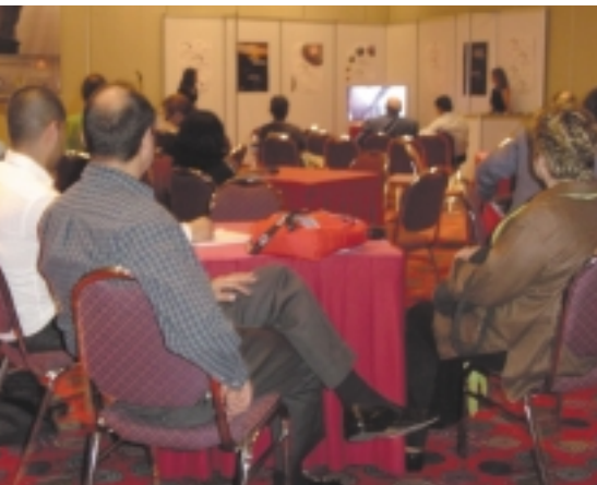
Acto de presentación pública de EGEDA.