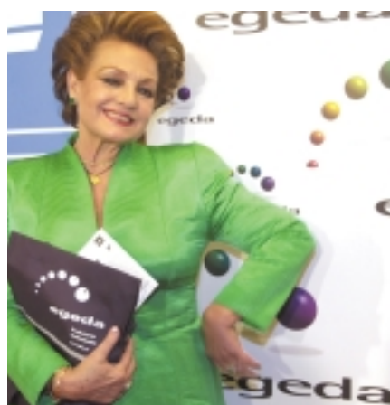
Carmen Sevilla, medalla de honor del CEC.

Finalizada la entrega de galardones, los espectadores pudieron asistir al estreno en España del internacionalmente premiado film de Sofia Coppola, Lost in translation .